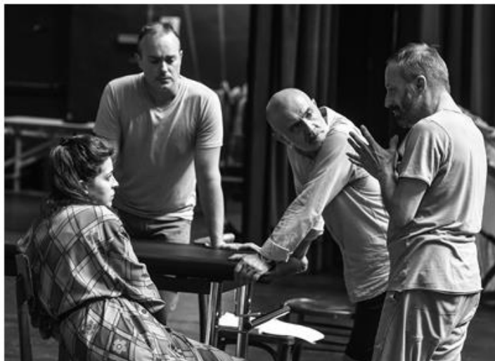
Il cast di María de Buenos Aires durante le prove dell'Operita Tango al Teatro Goldoni